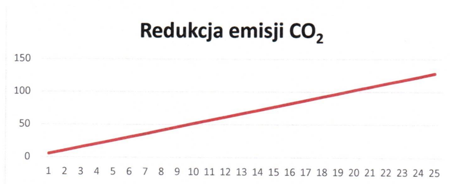
Rys. 3. Redukcja emisji CO 2

Instalacja grzewcza z wykorzystaniem kotła na paliwo gazowe ma znaczny wpływ na środowisko. Produkcja energii cieplnej z wykorzystaniem gazu ziemnego pozwala na redukcję emisji dwutlenku węgla, która miałaby miejsce w wypadku wytwarzania energii cieplnej w procesie spalania paliw kopalnych. Dla proponowanej instalacji wskaźnik ten pokazuje poniższy wykres (Rys.3).