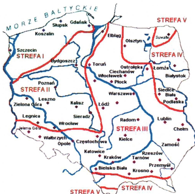
Rys. 1 Strefy klimatyczne Polski i temperatury obliczeniowe

Położenie obiektu, w którym planowany jest montaż, na mapie ma wpływ na pracę instalacji. W zależności od współrzędnych geograficznych rozbieżności w temperaturach projektowych mogą mieć znaczącą wartość. W skali kraju ilustruje to poniższa mapa (Rys.1).